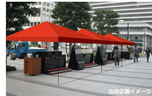
出店区画イメージ