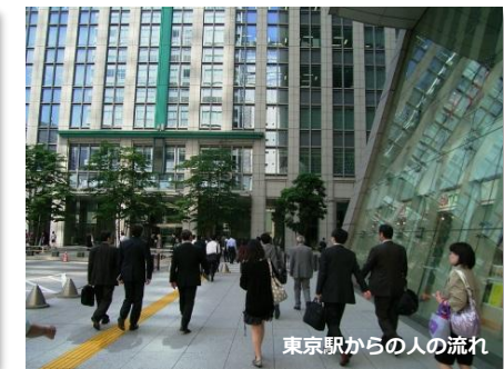
東京駅からの人の流れ